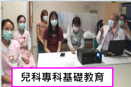
兒科專科基礎教育