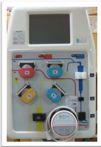
多功能血液淨化平台