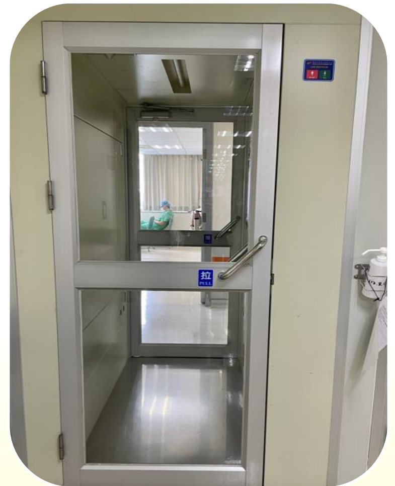
分區段設有氣洗室(air shower)