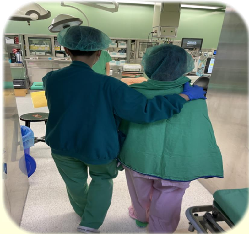
護理師帶病人進入手術室

♥ 採手術全期護理，手術病人入手術室後由專責護理人員給予病人完整的護理評估及手術相關指導等，秉持護理部親切、微笑、用心、關懷的理念，提供病人個別性、完整性且高品質的護理服務