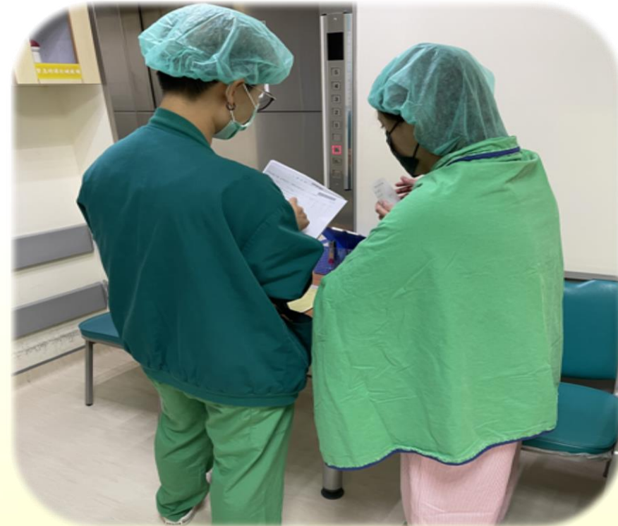
護理師向病人衛教